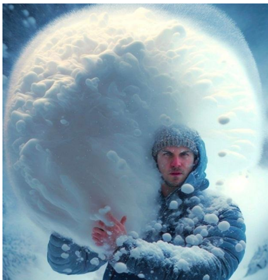
Рисунок 1. Фразеологизм «Нести пургу»