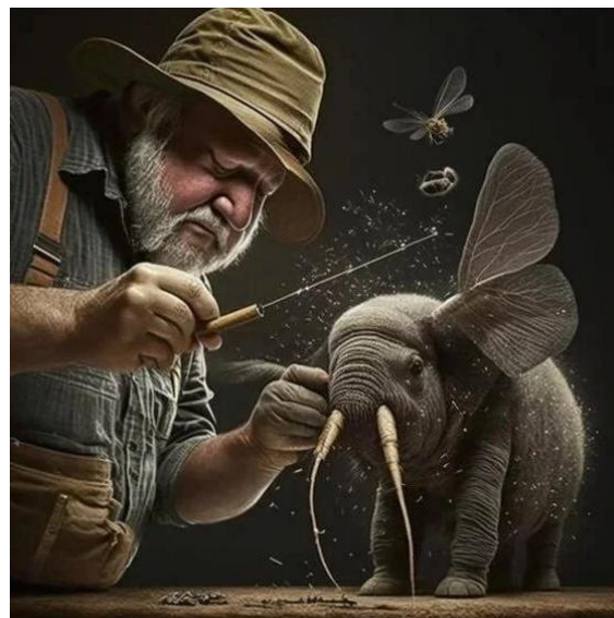
Рисунок 2. Фразеологизм «Делать из мухи слона»